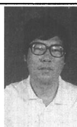
燕强携全体员工向全县人民问好 中保人寿保险广饶县营业部经理