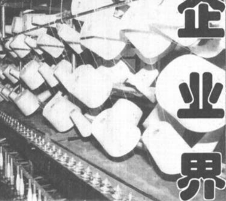
刊头说明：市第一染织厂通过转换经营机制，运用现代化科学管理手段，调动起500多名职工的工作积极性。截至1997年底，纺织涂布700万米，印花布800万米，年创产值5000余万元，利税200万元。图为生产车间一角。（高祥 刘伟 摄影报道）

在新的历史条件下，共产党员要不断加强党性锻炼，要有远大的共产主义理想，坚定的政治方向，自觉地学习建设有中国特色社会主义的理论和党的基本路线、方针、政策，牢固树立全心全意为人民服务的宗旨，想职工之所想，急职工之所急，帮职工之所需，时刻把群众的冷暖挂在心上，为职工办好事办实事。共产党员要坚定不移地贯彻执行党的基本路线，到改革和建设的第一线去，到党和人民最需要的地方去，与群众同甘共苦，增长才干。始终在职工中起模范带头作用，做努力工作、好学上进的模范，做无私奉献、多干实事的模范，做讲政治、讲原则的模范，做遵纪守法、坚持民主集中制原则的模范，做发扬共事、讲原则的模范，做维护职工权益、带领职工同心同德办好企业的模范，做遵纪守法、坚持民主集中制原则的模范，做发扬共事、讲原则的模范，做维护职工权益、带领职工同心同德办好企业的模范，做遵纪守法、坚持民主集中制原则的模范，做发扬共事、讲原则的模范，做维护职工权益、带领职工同心同德办好企业的模范。